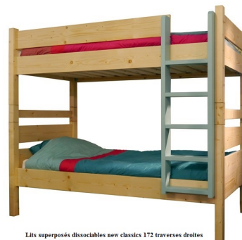
Lits superposés dissociables new classics 172 traverses droites avec option bicolor : vernis + vert léger

Voici les différences notables entre ces deux collections de meubles écologiques