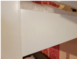
Aspect du bois des lits Mathy by Bols Dominique

Pour les meubles Dominique, le bois est plus "lisse" avec un aspect plus contemporain.